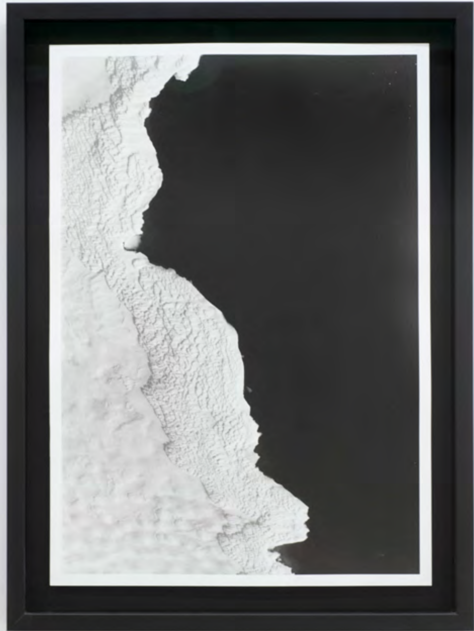
Gauche: Bodies of Water : 79°33,7'N 10°54,4' E (II), Droite: Bodies of Water : 9°33,7'N 10°54,4' E (I)