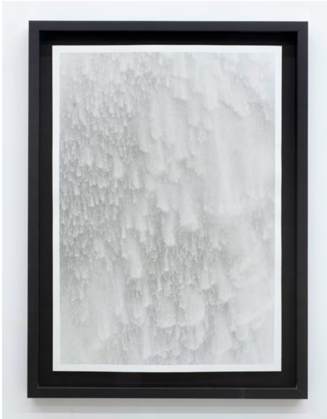
78°43,2'N 11°27,7'E (II), Bodies of Water, 2023