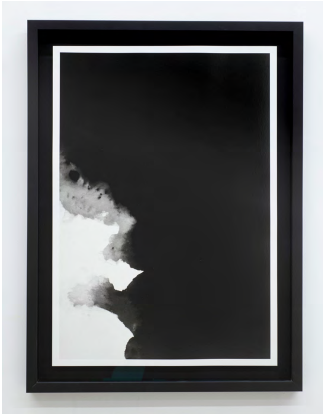
79°33.7'N 10°54.4'E (I), Bodies of Water , 2023