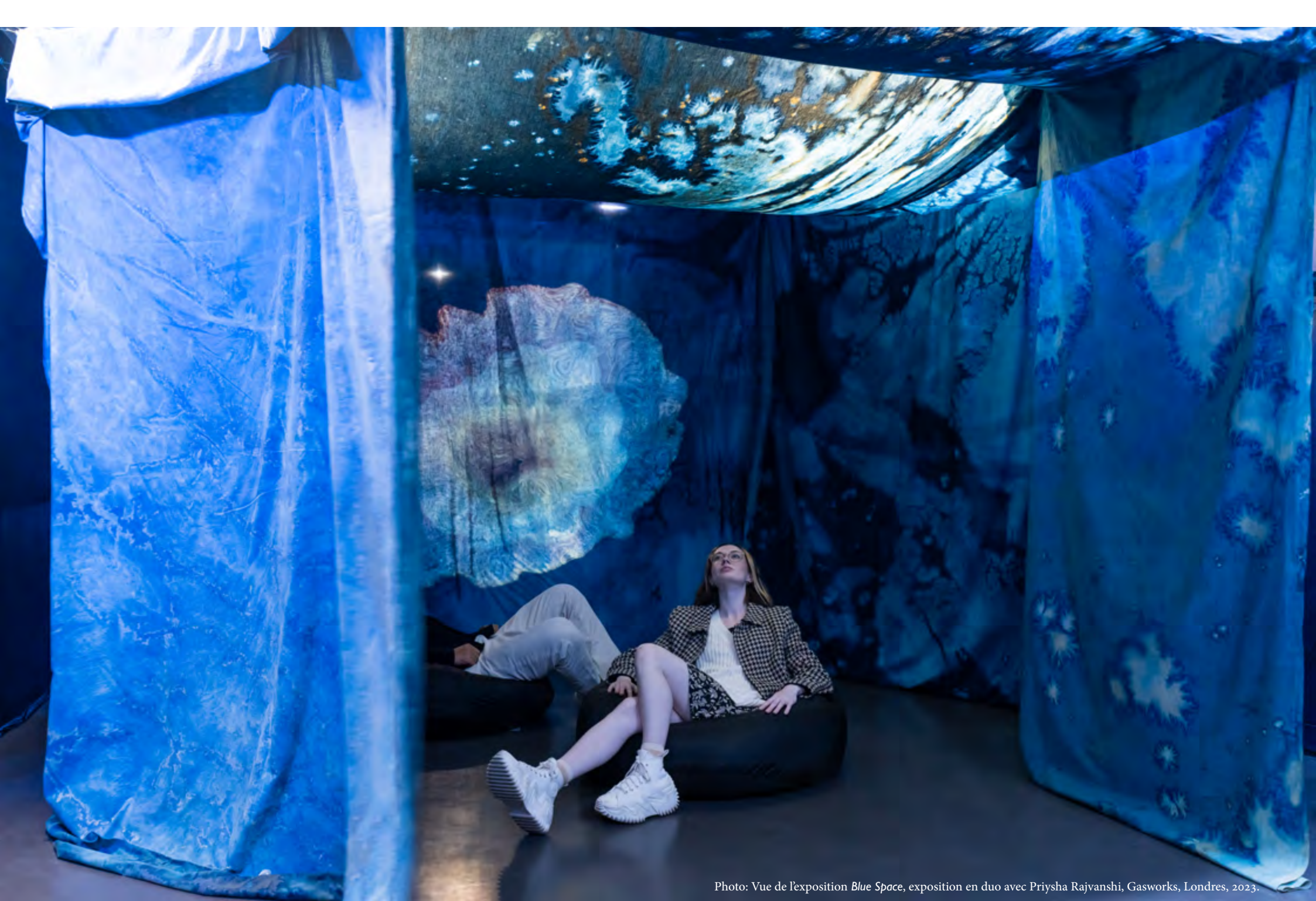
Photo: Vue de l'exposition Blue Space , exposition en duo avec Priysha Rajvanshi, Gasworks, Londres, 2023.