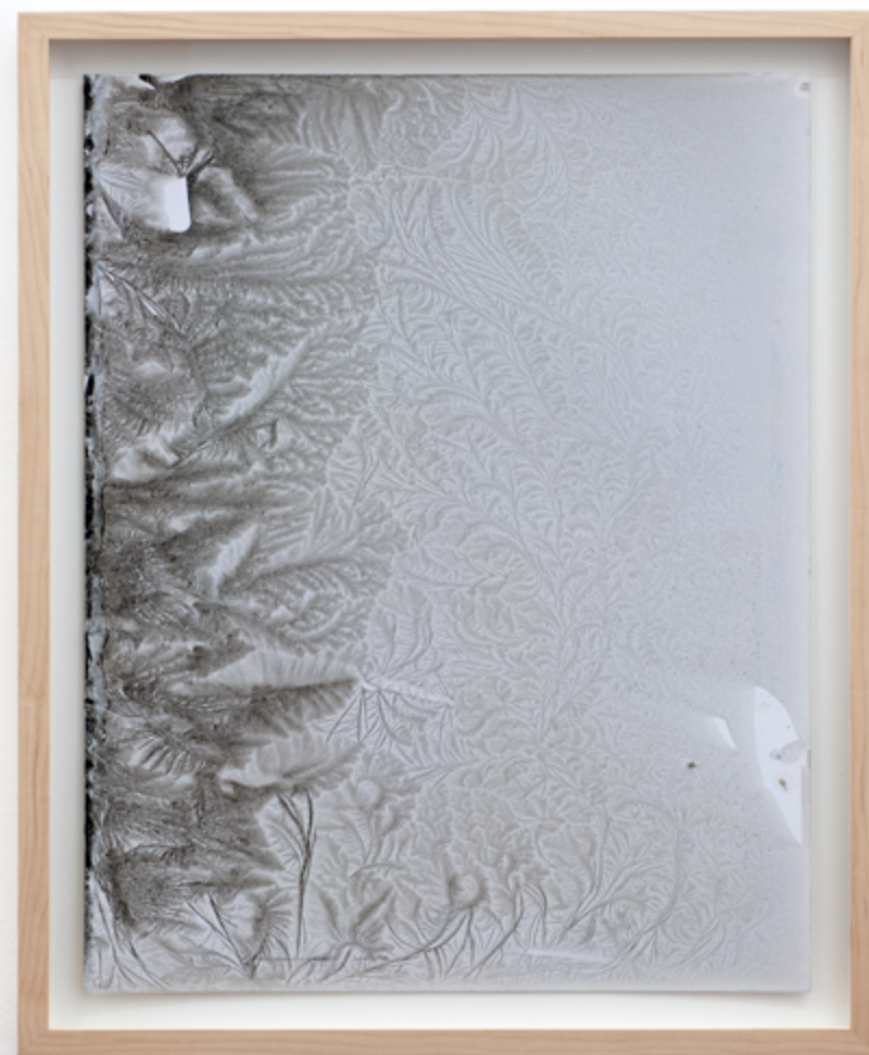
François Génot n°4, n°5, n°8 et n°6 , 2021 Gélugraphies (15.02.21 / -5°C / Diedendorf) Dessin à l'encre gelée sur papier 51 x 36,5 cm Pièces uniques