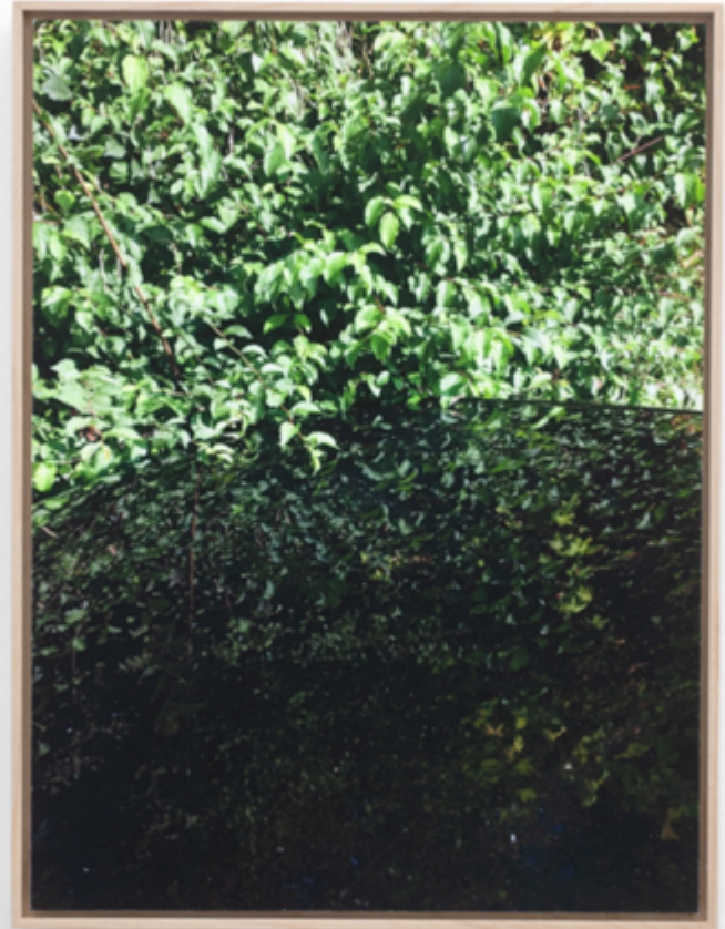
François Génot BMW , 2017 Among the leaves Photographie numérique sur papier (Hanemüle) Encadrement : 25,1 x 19 cm Pièce unique